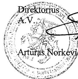
Direktorius A.V. S. Artūras Norkevičius

Kalėjimų departamentas prie Lietuvos Respublikos teisingumo ministerijos L. Sapiegos g. 1, LT-10312 Vilnius, Kodas 288697120 Tel. (8 5) 271 9003; Faks. (8 5) 275 2778; El. paštas kaldep@kaldep.lt