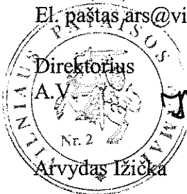
Direktorius A.V. S. Arvydas Izickas

Vilniaus pataisos namai Rasų g. 8, LT-11350 Vilnius, Kodas 188721271 Tel. (8 5) 264 9310; Faks. (8 5) 268 5260; El. paštas ars@vilniauspnm.lt